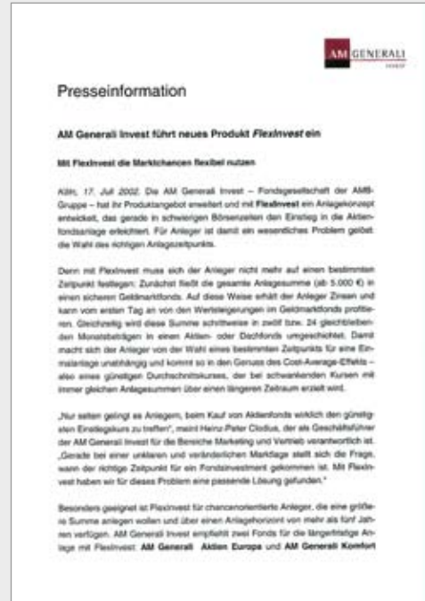
Press release with graphics.